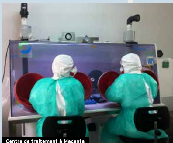
Centre de traitement à Macenta

La forte implication de l'Institut Pasteur en Guinée et les attentes exprimées par les autorités guinéennes suite à la crise Ebola ont conduit le 21 septembre 2015 à la signature d'un protocole d'accord pour la création de l'Institut Pasteur de Guinée, 33 e membre du Réseau international des Instituts Pasteur. Il aura pour objectif de répondre aux urgences épidémiques, de participer à la surveillance et à la recherche sur les maladies infectieuses et de former et accompagner les scientifiques guinéens dans la prévention des épidémies.