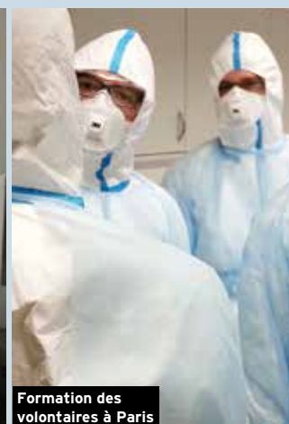
Formation des volontaires à Paris