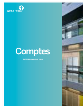
LES COMPTES 2015