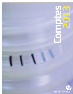
LES COMPTES 2013