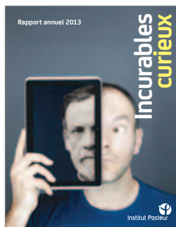
RAPPORT ANNUEL 2013